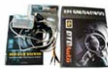
OBD-I GM Scanner