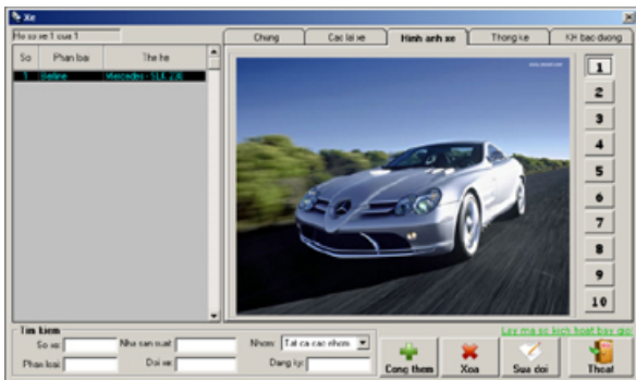
Hình ảnh xe

Chương trình yêu cầu cài đặt trong khi máy tính của bạn đang kết nối với Internet hoặc máy tính cần phải cài đặt MS.net Framework 1.1 trước đó